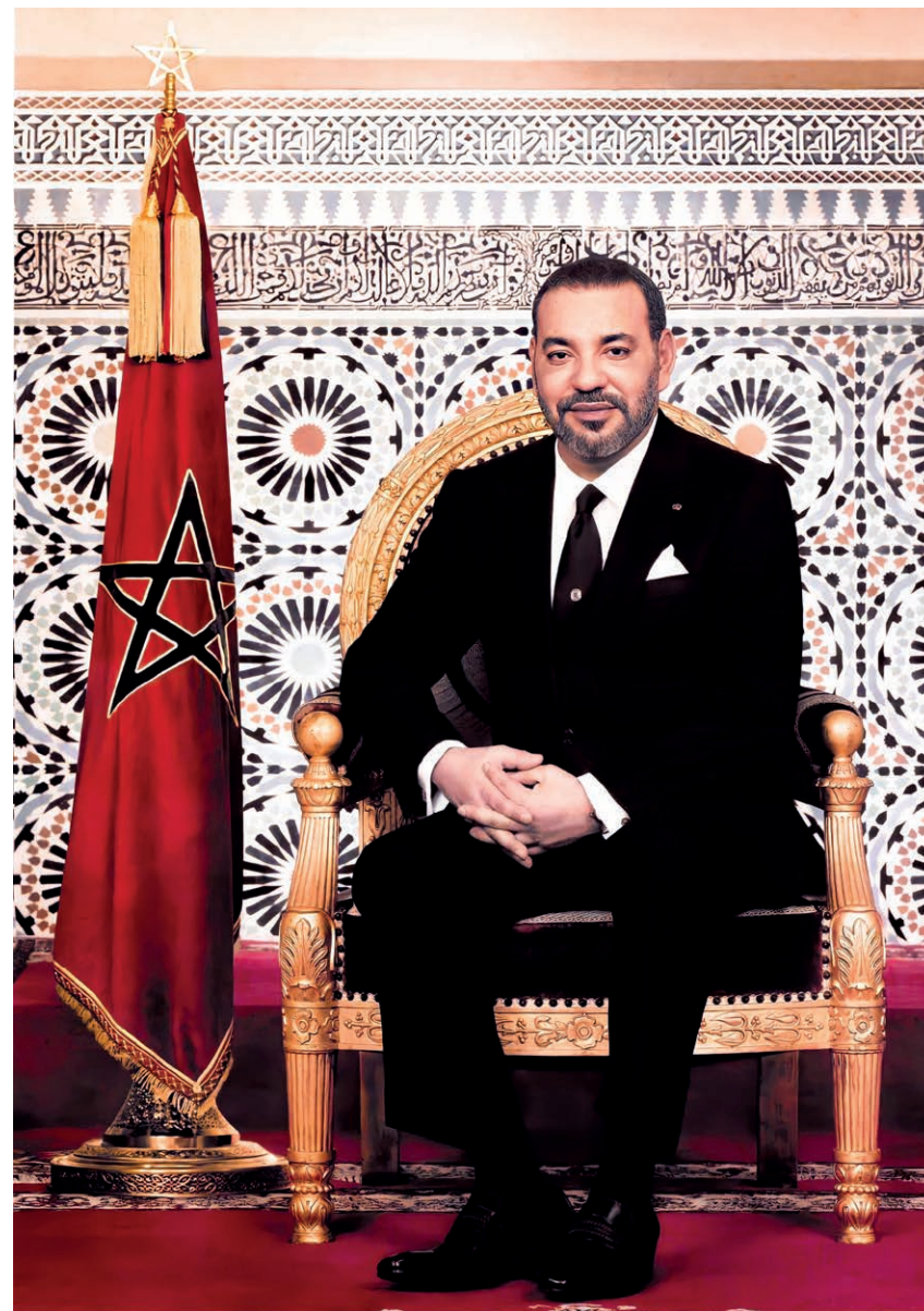
SA MAJESTÉ LE ROI MOHAMMED VI QUE DIEU LE GLORIFIE